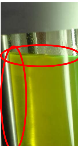
Visuelle Analyse der Auflösung verschiedener in der Flüssigkeit vorhandener Substanzen