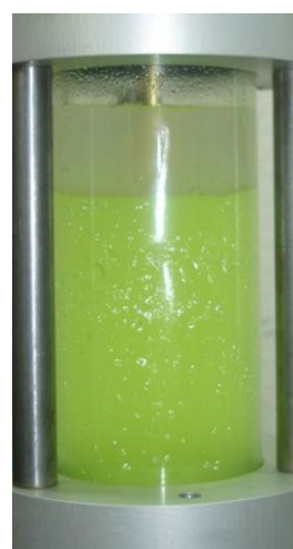
Kältemittel + UV durch Wasser verunreinigt