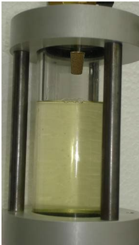
Öl und Kältemittel mit guter Mischbarkeit