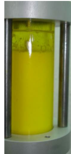
Schlechte Mischbarkeit zwischen Öl und Kältemittel