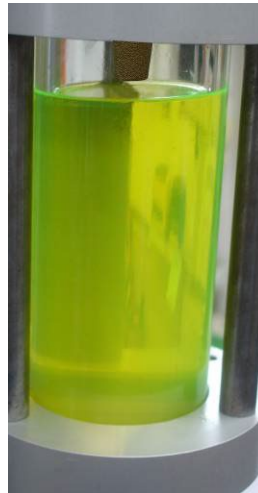
Öl, Kältemittel und UV mit guter Mischbarkeit