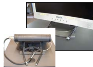
Monitor- / Geräte- sicherung