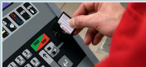
Fahrzeugfüllmengen-Solldatenbank für Pkw auf updatefähiger Speicherkarte