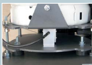
Stoßgeschützte Waagenkonstruktion für den mobilen Einsatz