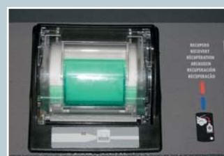
Integrierter Thermo-Drucker mit Mehrfachdruck