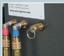
Luftablassventil und Service-schlauchanschluss außen